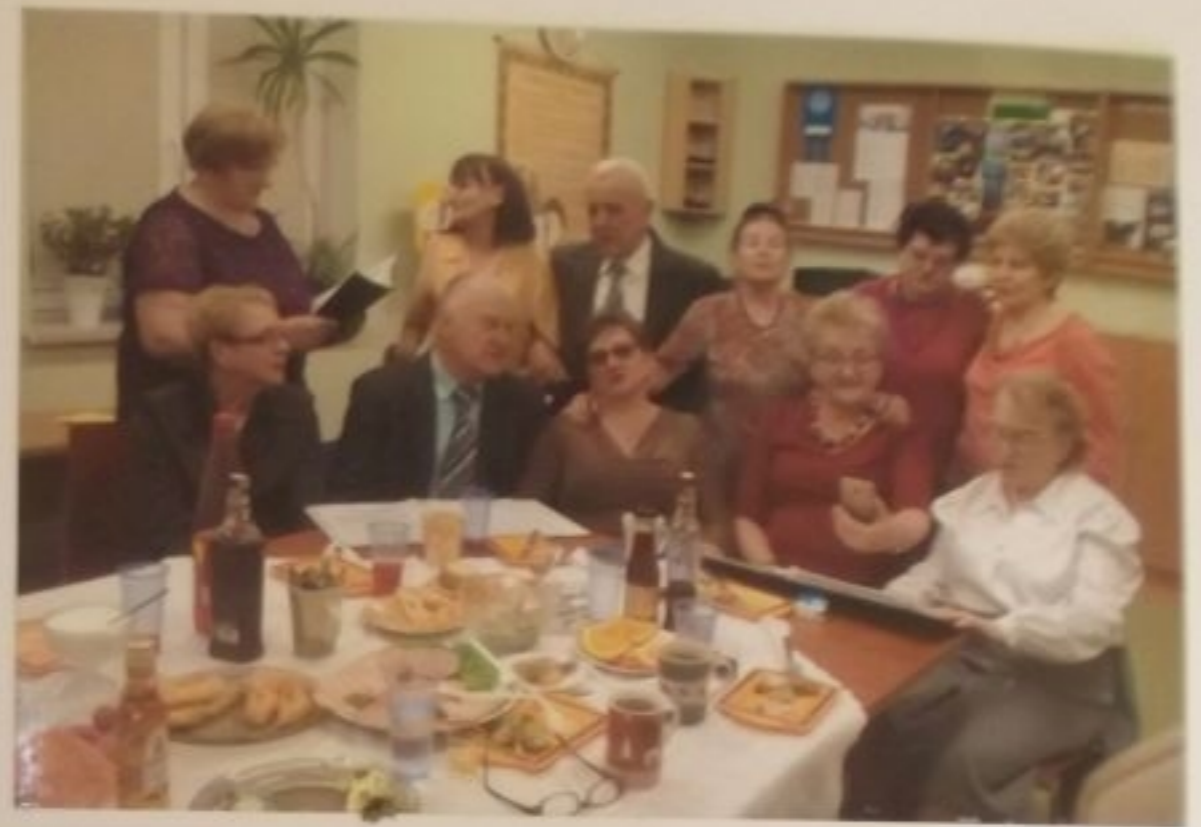
Na stołach niczego nie brakowało