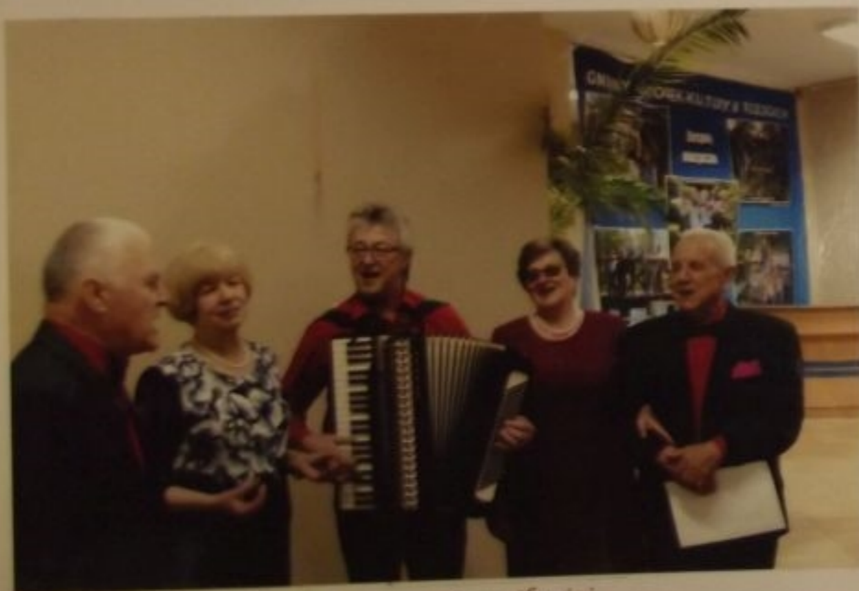
Na luzie śpiewa się najlepiej