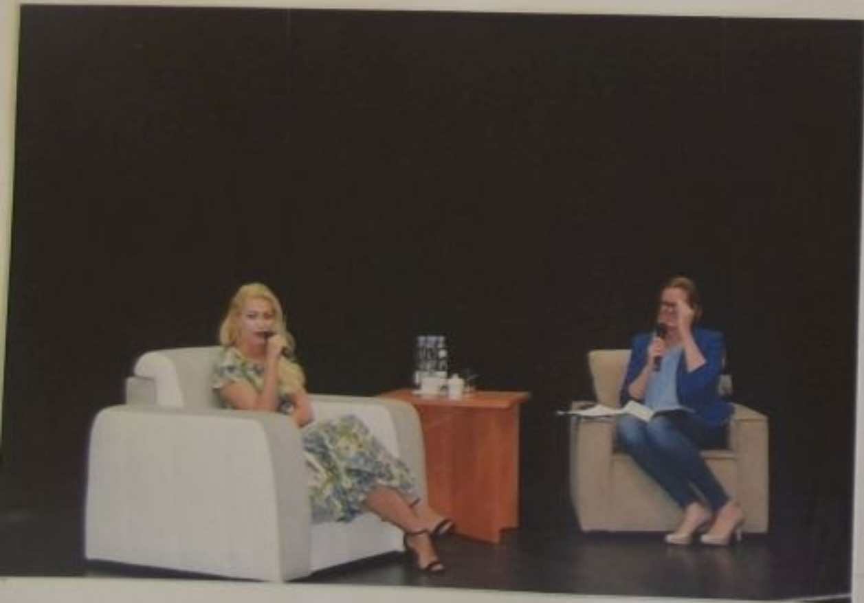
Spotkanie autorskie z Katarzyną Bondą - 7. 09. 2018r