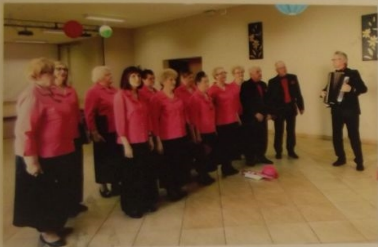
Zespół prezentuje swoje piosenki