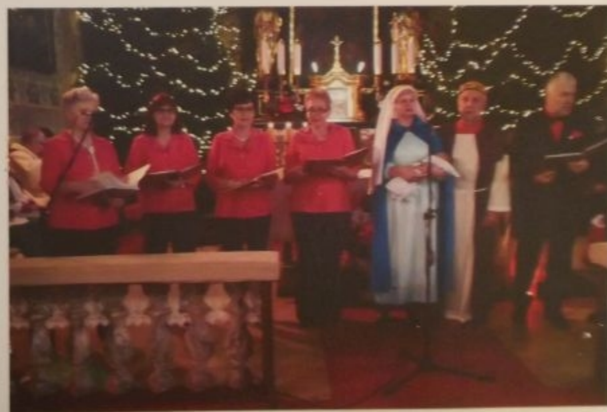
Nasze "Jasełka" w kościele w Jonkowie