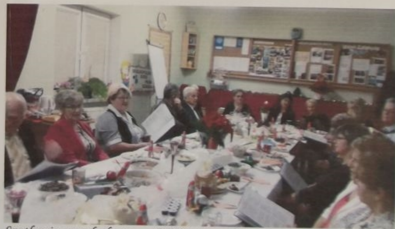
Spotkanie w opłatkowe w GOPS 14 grudnia 2018r