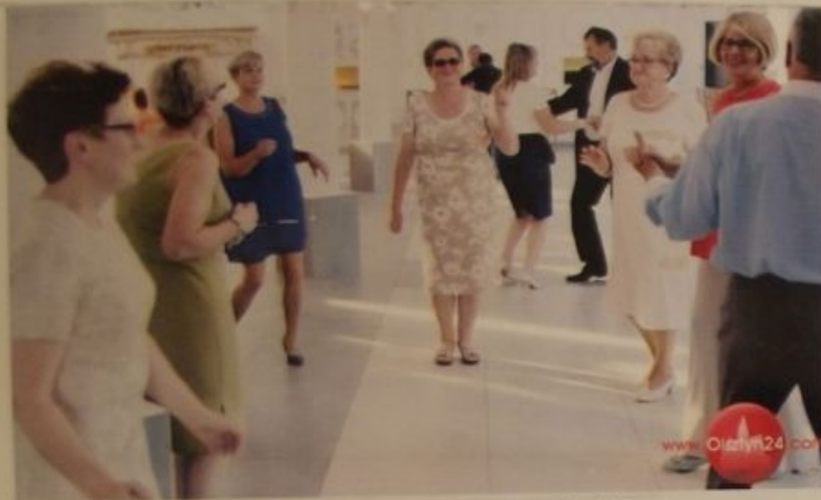
Szefowa z gracją porusza się na parkiecie