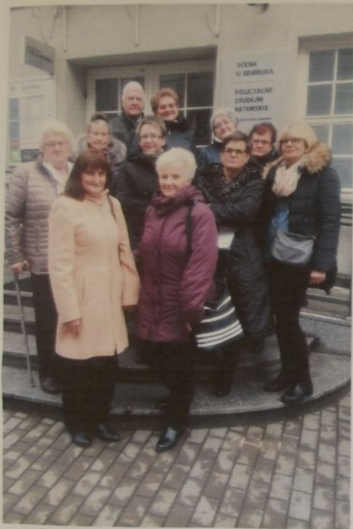
„Iskierka Nadziei” na wyjeździe do teatru 14.11.2018r