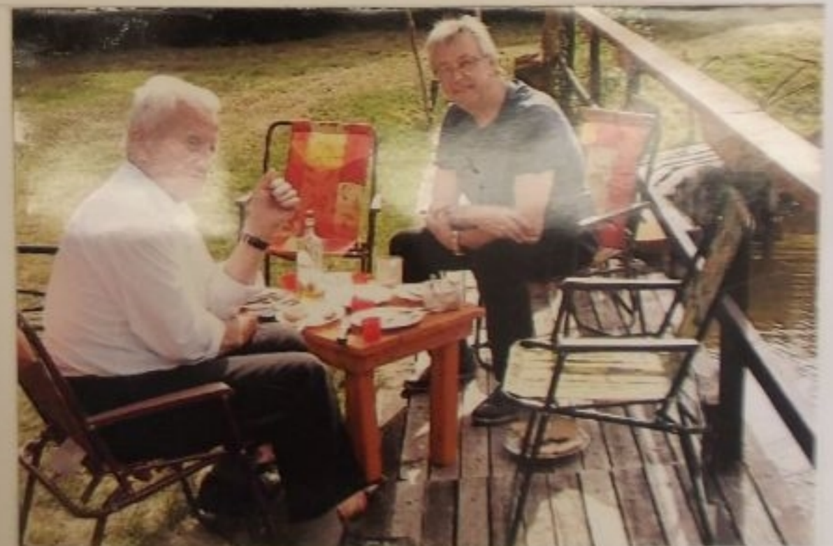
Po występach odpoczynek na działce.