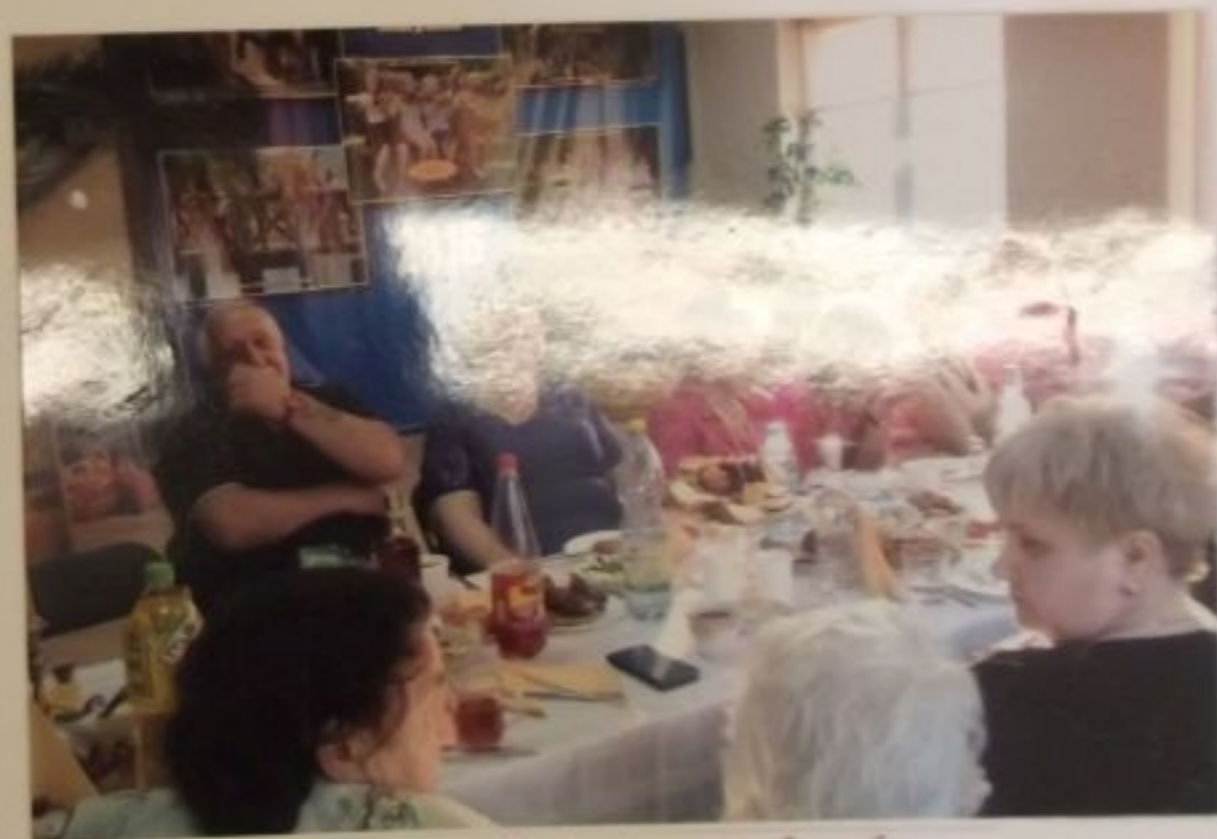
Data na zdjęciu jest nieaktualna