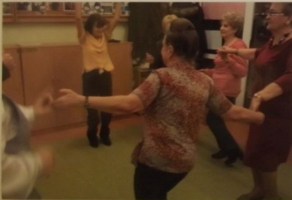
- chęci do zabawy też.