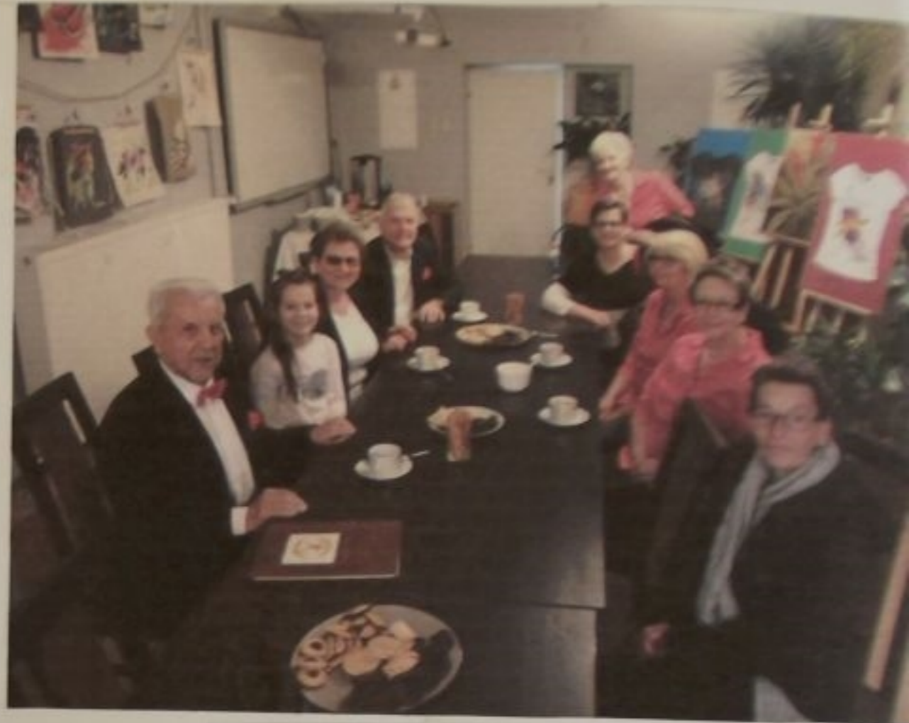
Po występie na kawie