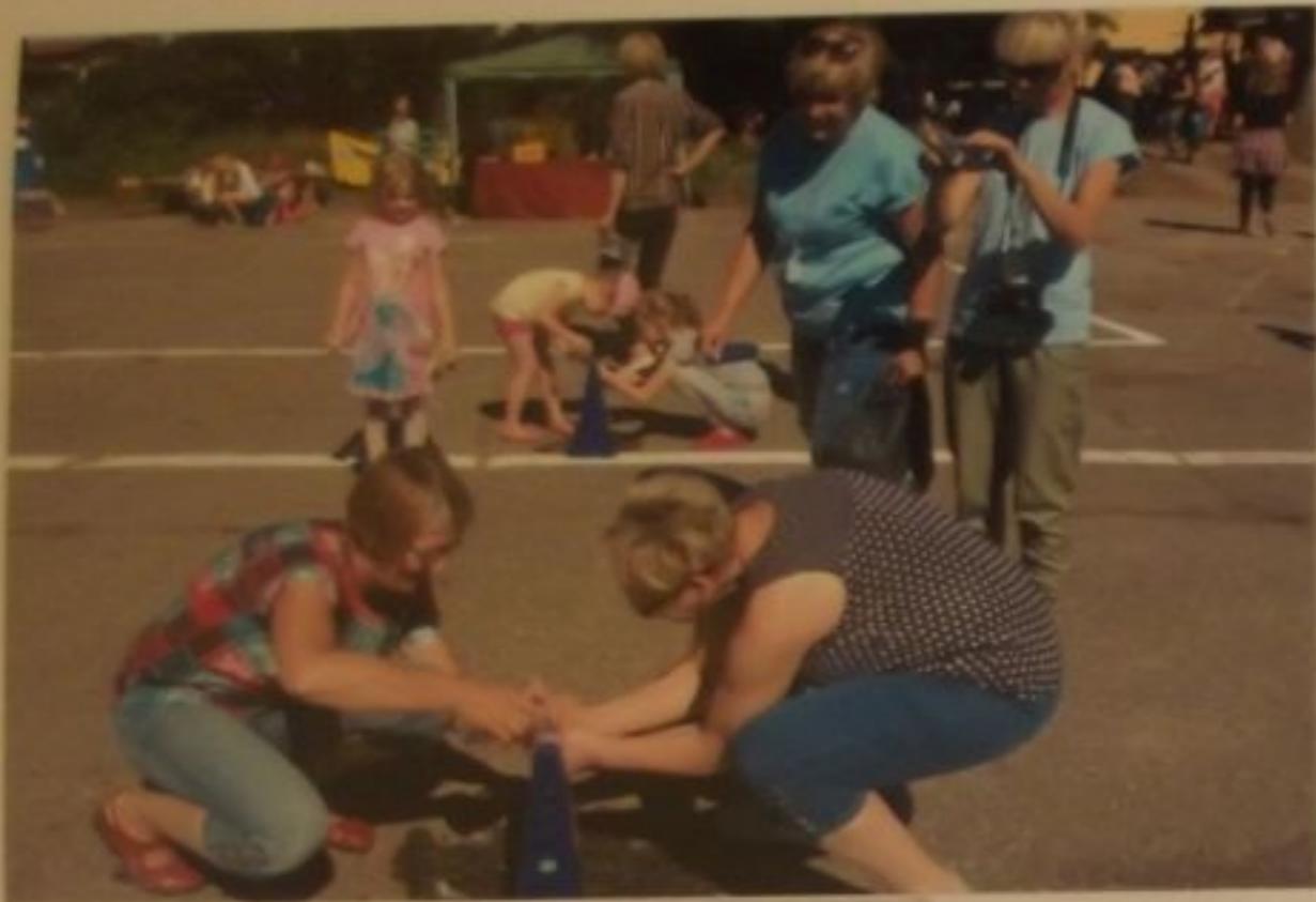
Konkurs w napełnianiu butelki wodą.