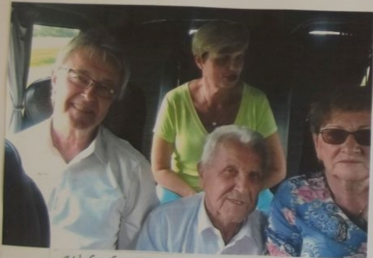
W drodze powrotnej z występów