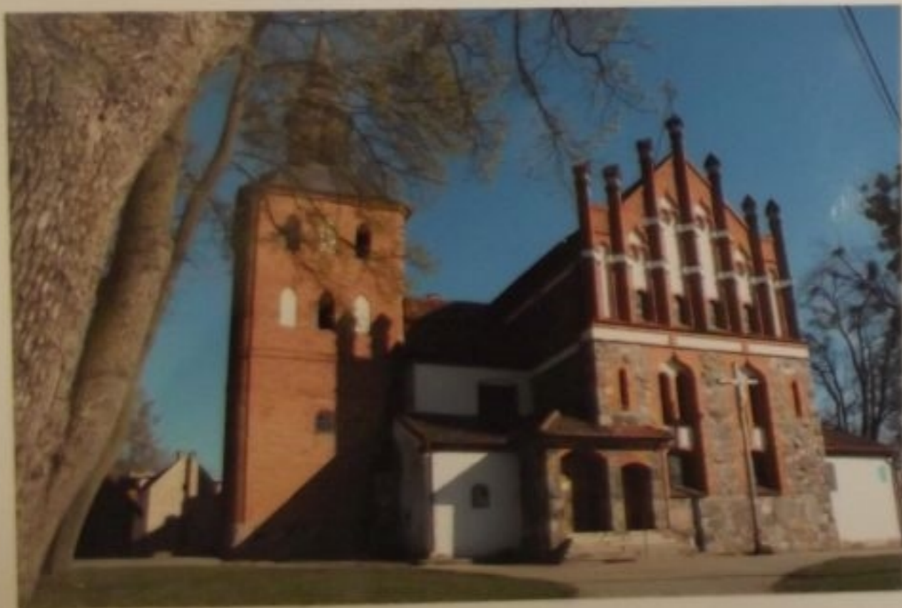
Zabytkowy Kościół w Jonkowie