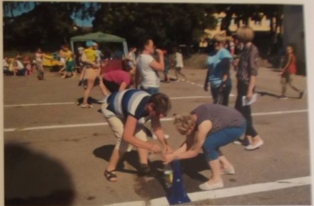
Wygrała "Iskierka Nadziei" - wiadomo, doświadczenie.