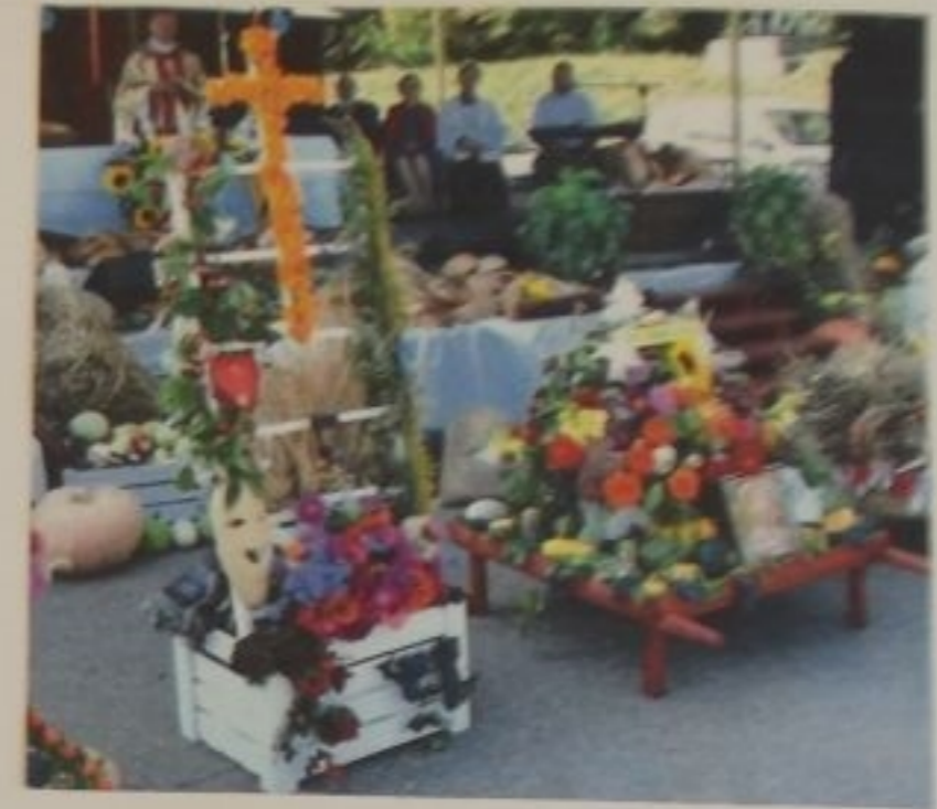
Obok - nasz Wieniec Dożynkowy