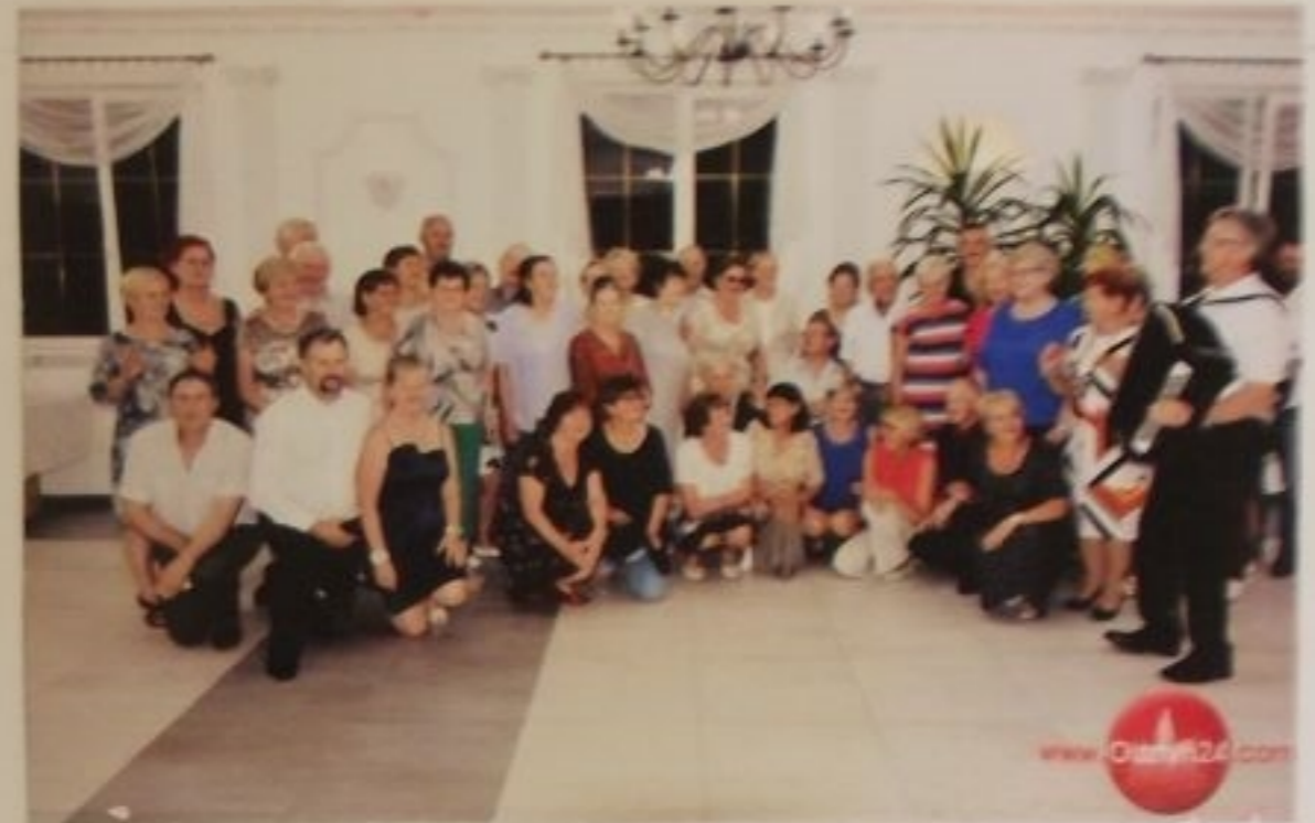
Uczestnicy biesiady na wspólnym zdjęciu