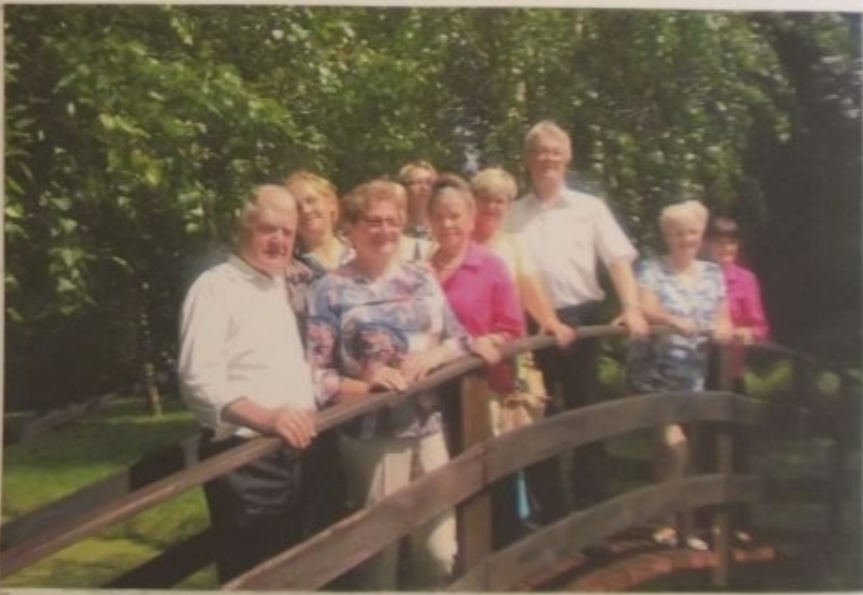
Niestety, mnie na tym zdjęciu nie ma