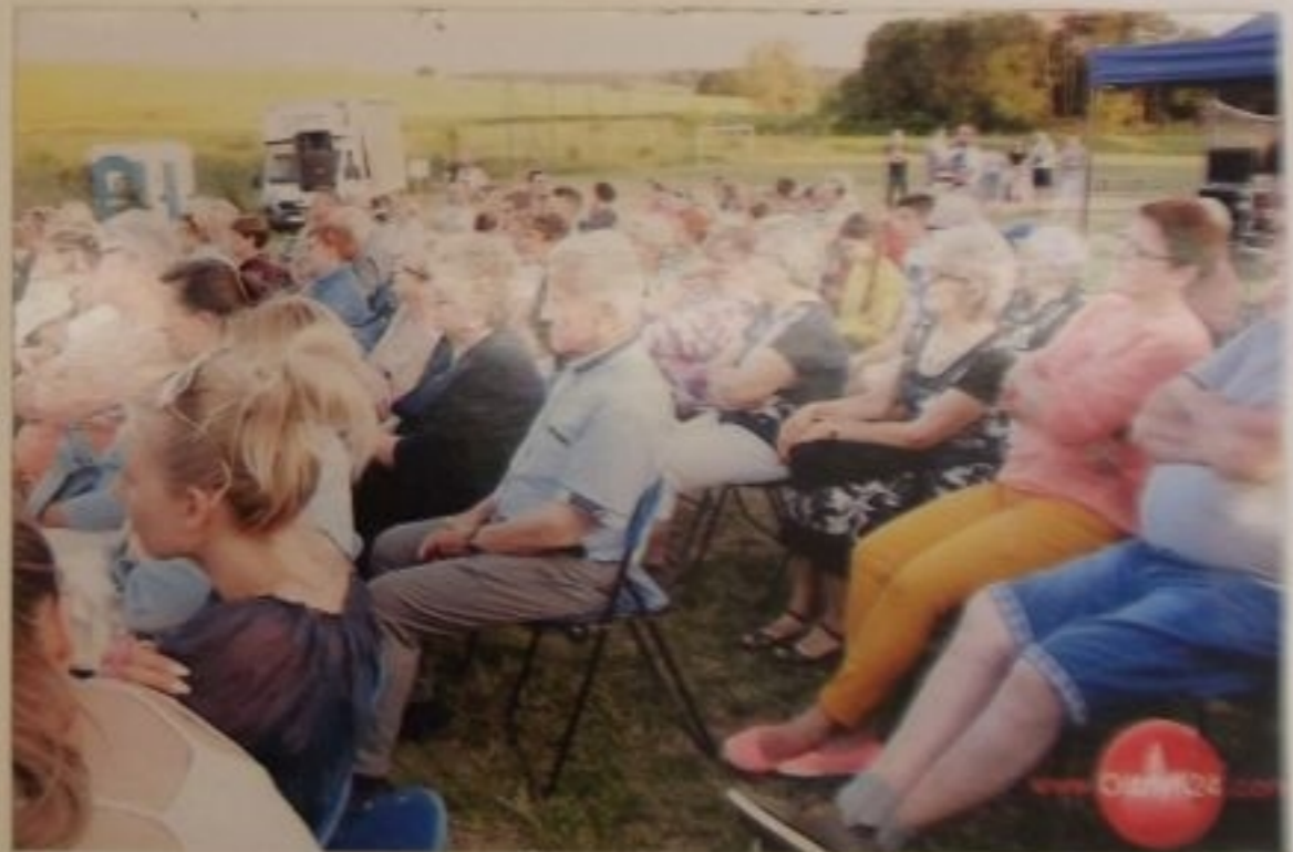
Na widowni Teatru "Pod Brzozą".