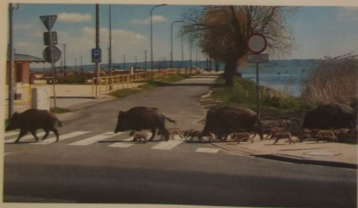
Te dziki wiedzą jak należy przechodzić ulicę.