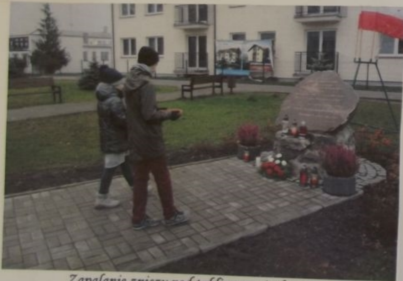
Zapalanie zniczy pod tablicą pamiątkową