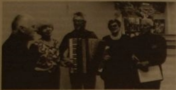
Iskierki Nadziei odwiedziły seniorów z Rozóg

Do pierwszego spotkania przedstawicieli obu organizacji doszło już listopadzie ubiegłego roku, podczas wojewódzkich uroczystości z okazji dnia seniora w Olsztynie.