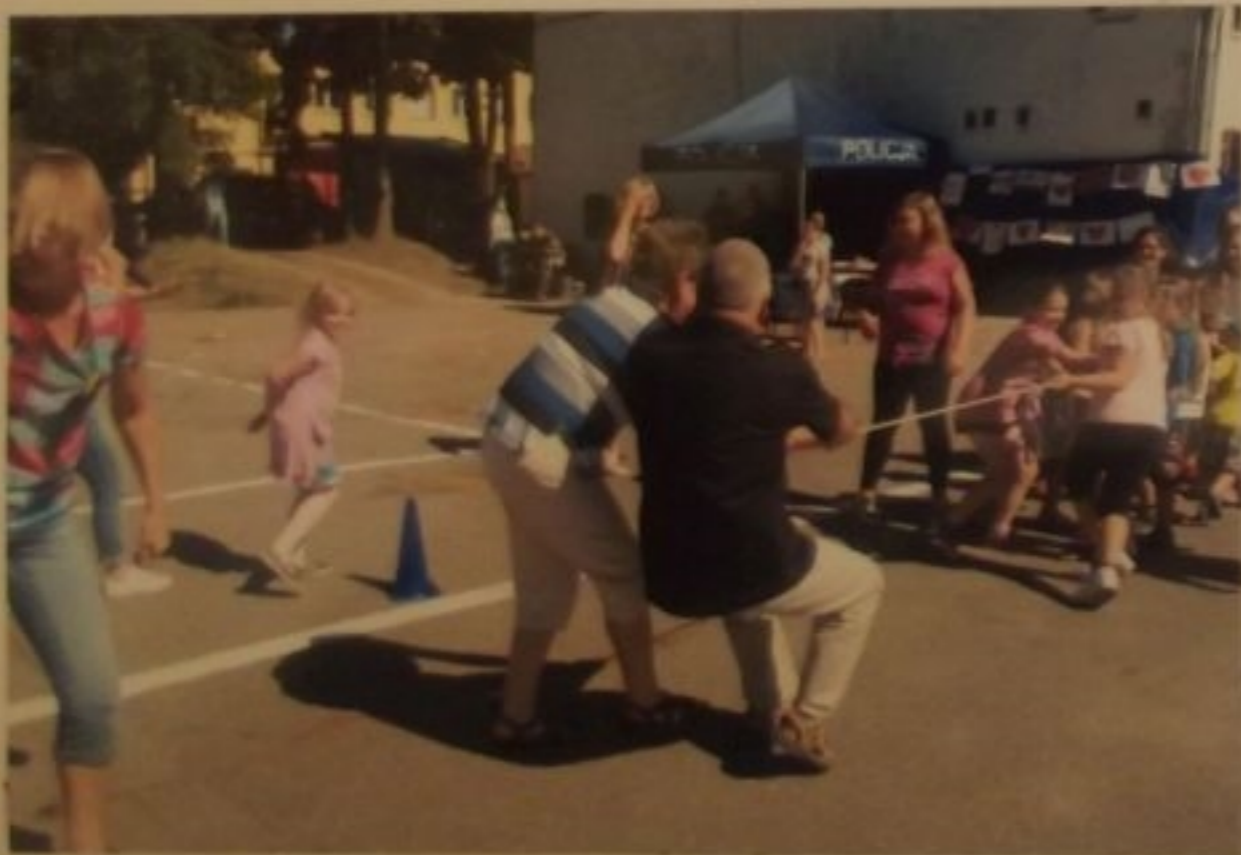
W przeciąganiu liny górą były dzieci - wygrały bezapelacyjnie.