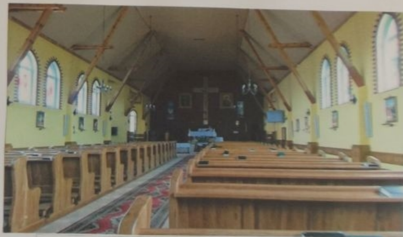
W Mikołajkach wystawiliśmy spektakl pt. "Wieczorny Dzwon" Występ był bardzo dobrze przyjęty przez zgromadzoną na Mszy publiczność i nagradzany okłaskami.