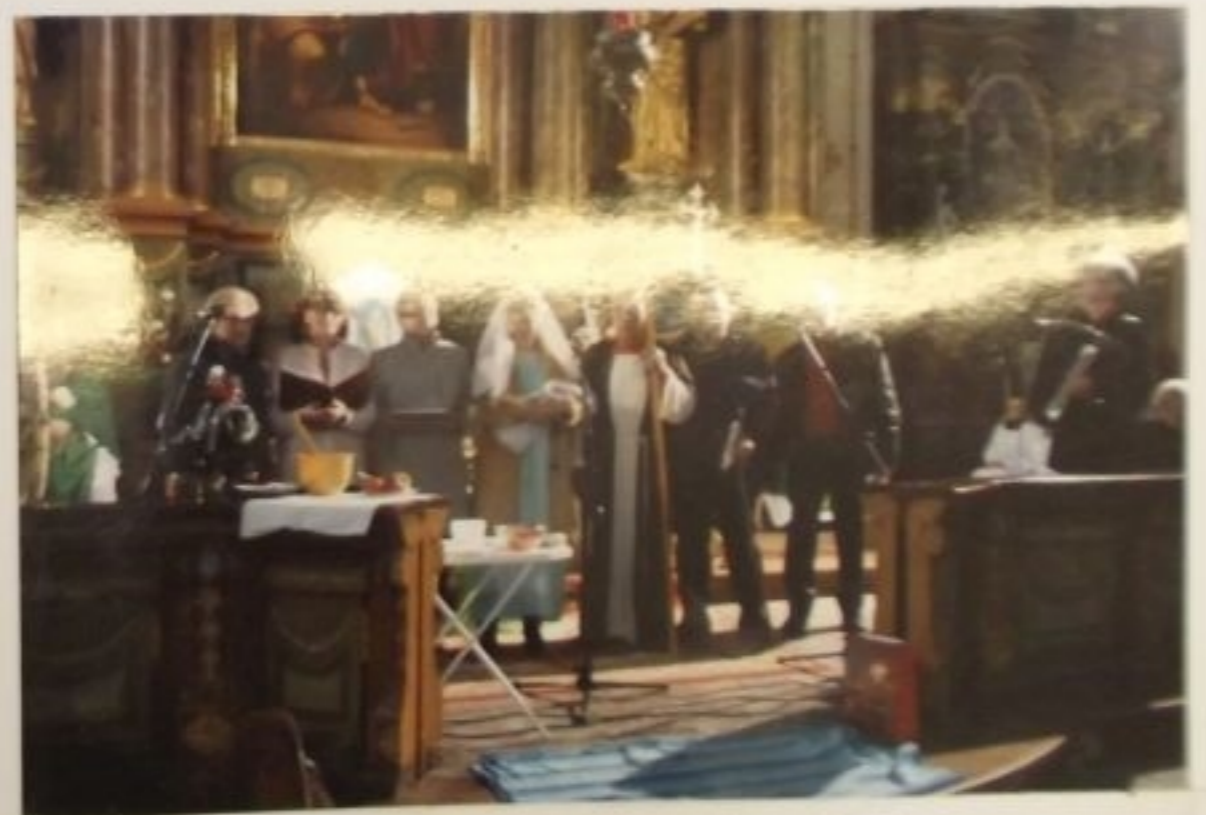
Występy "Iskierki Nadziei" w kościele w Reszlu