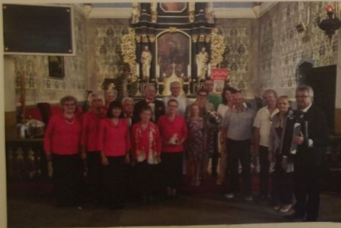
"Iskierka Nadziei" z osobami towarzyszącymi tuż po występie w kościele