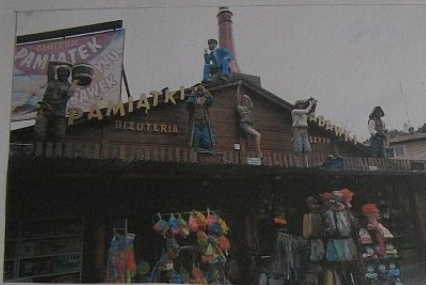
Pomysłowa dekoracja sklepu z pamiątkami