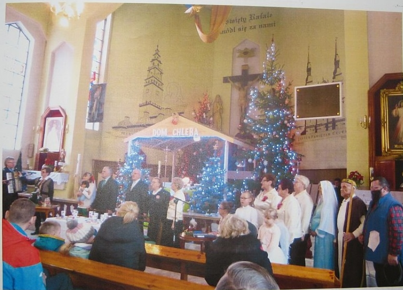
Pokaz „Jasełek” w Kościele Św. Rafała Kalinowskiego w Mragowie 31 stycznia 2016 r.