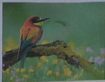
Spotkanie na działkach Odnaczenia dla Osób szczególnie zasłużonych