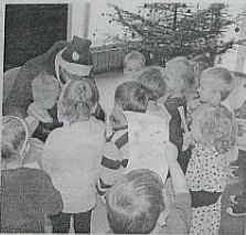
Mikołaj obiecał dzieciom, że odwiedzi je w przyszłym roku

Po występie uświadomiliśmy dziewczynkom i chłopcom, że to nie Mikołaj przyszedł, i przywitał się z naszymi dziećmi. Porozmawiał z nimi, zachęcał, aby były grzeczne, słuchały rodziców i pań w przedszkolu. Chętnie wysłuchał śpiewanych przez dzieci koled, piosenek i wierszyków. Dzieci z każdej grupy narzeczywały na karteczkach prezenty, które chciałyby do-