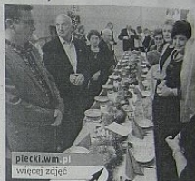
piecki.wm.pl więcej zdjęć

Wystawiono jasełka pt.: „Wieczór wigilijny”, które obejrzel zaproszeni goście i seniorzy. Po uciech dla dużej części uczestników zaprosili uczestników spotkania do sali lunchowej, gdzie przy rozświetlonej, straszyj choince na pięknie przybranych stołach królowały potrawy wigilijne, owoce, ciasta, pierniki, także napoje gorące kawa i herbata.