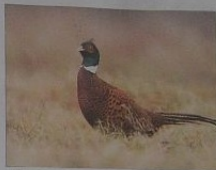
Występy w Rucianym - Nidzie 3-4 czerwca 2014r.

MIEDY? I GDZIE? MOŻNA OBEJRZEĆ TEN SPEKTAKL? POZDRAWIAM ISKIERKĘ,