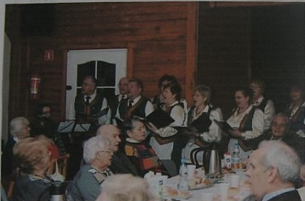
Występ Iskierki Nadziei na spotkaniu oplatkowym mragowskiego Stowarzyszenia Dzieci Wojny w sali ORBITA.

Dom Pomocy Społecznej 11-010 Barczewo, ul. Kraszewskiego 17 tel/fax (089) 514-85-74, (089) 514-84-21 e-mail: sekretariat@dpsbarczewo.pl, dyrektor@dpsbarczewo.pl www.dpsbarczewo.pl NIP 739-13-75-267, REGON 510917873